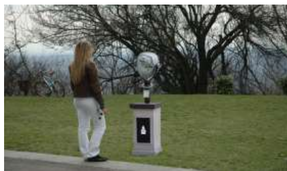
Sl.13 i 14 - Valorizovano: vidikovac opremljen dvogledima