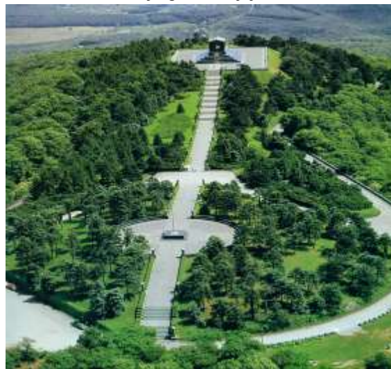
Sl. 2 - Spomenik neznanom junaku Picture 2 - The Tomb of the Unknown Soldier

SPOMENIK NEZNANOM JUNAKU - podignut je od 1934. do 1938. godine od strane posebnog formiranog Državnog odbora za podizanje spomenika jugoslovenskom Neznanom junaku. Spomenik je zamišljen u obliku mauzoleja sa karijatidama sa obe strane ulaza, koje predstavljaju žene u narodnim nošnjama pojedinih jugoslovenskih pokrajina: na istočnoj strani su figure Hercegovke, Makedonke, Bosanke i Dalmatinke; na zapadnoj strani su Hrvatice, Slovenke, Crnogorke i Srkinje. Građen je od crnog jablaničkog granita, a nacrt za spomenik i izvođenje radova na skulpturama dao je poznati vajar Ivan Meštrović. Spomenik je izgražen na zaravni, na mestu ruševina srednjovekovnog grada Žernova. Pre podizanja današnjeg spomenika, još 1922. okolno stanovništvo je podiglo jedan skroman kameni spomenik Neznanom junaku. To prvobitno obeležje, u obliku kamenog krsta, sada se nalazi u porti crkve u Belom Potoku. Kasnije, ideja o obeležavanju groba srpskog ratnika prerasla je u razmere jugoslovenskog značaja, usled čega je i došlo do podizanja monumentalnog spomenika na vrhu Avale.