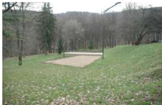
Sl. 23 i 24 - Livada kod Čarapićevog bresta, u podnožju Avale Picture 23 & 24- A field near Carapic's Elm at the foot of Avala

Pored gore pomenutog slobodnog penjanja, na Avali ima puno prostora za različite grupne sportove. Odbojka na betonu i odbojka na pesku samo su jedni od njih.