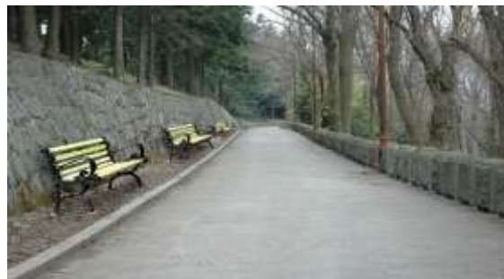
Sl. 5 i 6- staza koja vodi oko Spomenika neznanom junaku