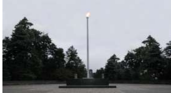
Sl. 9 i 10- Postojeći izgled: centralni plato za večni plamen