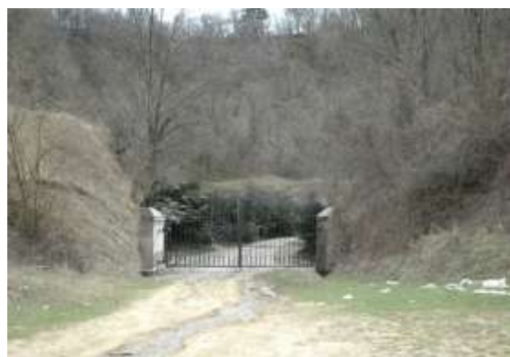
Sl. 19 i 20 - Postojeći izgled: ostaci rimskog rudnika žive Picture 19 & 20- Current state: The remains of the mercury mine

Kao što su Slovenci i mnogi drugi, od svojih iskorišćenih rudnika napravili atrakciju, tako bismo i mi mogli da pretvorimo ostatke rimskog rudnika žive u muzej pod otvorenim nebom. Tu bi kustosi objašnjavali posetiocima geološki sastav tla i istoriju rudnika.