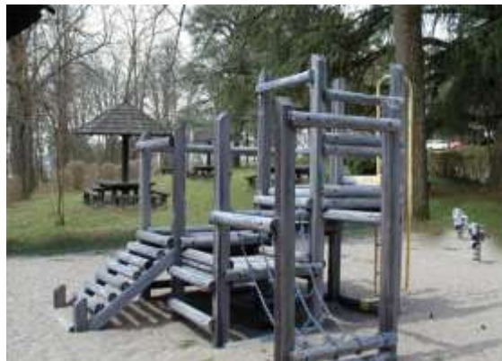
Sl. 17 i 18 - Valorizovano: igralište za decu Picture 17 & 18- Valuated: A playground for children

Kao što u svim velikim tržnim centrima postoje igraonice za decu sa profesionalnim animatorima, tako smo i mi zamislili igralište za decu na samom ulazu na Avalu.