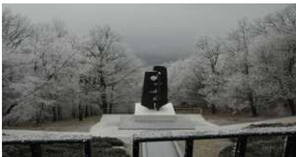
Sl. 3 - Spomenik sovjetskim ratnim veteranima picture 3 – The Monument to Soviet Veterans

SPOMENIK SOVJETSKIM VETERANIMA - nalazi se na severnoj padini Avale. Podignut je