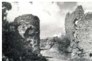
Sl. 1 – Grad Žrnov Picture 1 – City Žrnov

Još u preistorijko doba Avala je koristila ljudima, što se vidi iz ostataka preistorijskih rudarskih jama u Šupljoj steni kod Avale. U rimsko doba na njoj je postojalo manje naselje. U srednjem veku na vrhu Avale nalazilo se utvrđenje građeno od kamena- grad Žrnov, koji je štitio avalske i obližnje rudnike i kontrolisao prilaz Beogradu. Turci su osvojili Žrnov u XV veku i preuredili ga za svoje potreba. U drugoj polovini XV veka na Avali se nastanio turski harambaša Porča, koji je sa svojom družinom držao grad Žrnov, i kontrolisao put za Beograd. «Porča od Avale» kako su ga zvali, ostavio je mučne uspomene kod našeg naroda. On je napadao, pljačkao i ucenjivao okolno srpsko stanovništvo. Hrabri Zmaj Ognjeni Vuk, na molbu opljačkanih stanovnika okolnih sela Avale, došao je i lično ubio harambašu Porču. Po narodnom predanju koje je sačuvano u okolini Beograda, Porča je poginuo na samom vrhu Avale kod stare tvrđave, pred «Čemerli kulom», za čiju ga je kapiju Zmaj Ognjeni Vuk prikovao svojim kopljem. Kasnije Žrnov je više puta rušen i obnavljan, a od XVII veka on je ostao u ruševinama.