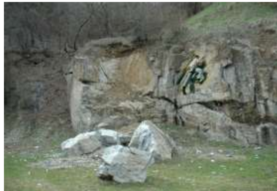
Sl. 21 i 22 - Stene kod starog rimskog rudnika Picture 21 & 22 - Rocks near the old Roman mine

U okviru rudnika žive postoji mogućnost da se osposobe okolne stene za slobodno penjanje ili free climbing. Profesionalci bi kategorisali stene po težini i približili ovaj sport širokim masama.