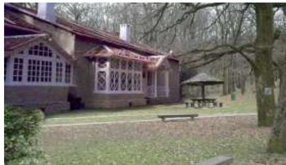
Sl. 11 i 12 - Postojeći izgled: Kiosk na proplanku za piknik