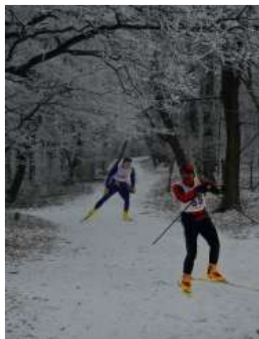
Sl. 15 i 16 - Postojeći izgled: staza za šetnju pod snegom