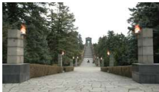
Sl. 7 i 8 -Staza koja vodi do Spomenika neznanom junaku